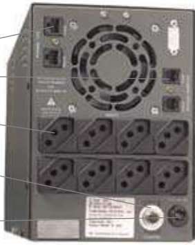
traseira do modelo LAN